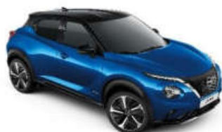
Metallic Blue + Czarny dach - XHV