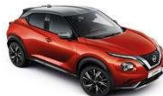
Czerwony Fuji Sun Red + Srebrny dach - XEZ