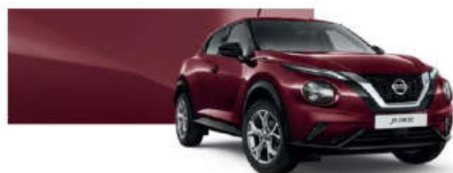
Burgundowy - NBQ