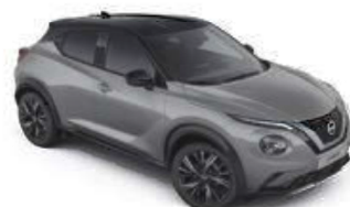
Szary ceramiczny + Czarny dach - XFU