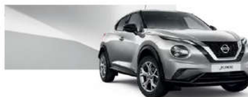
Srebrny - KYO