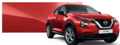
Czerwony - Z10