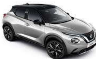
Srebrny + Czarny dach - XDR