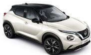
Biały perłowy + Czarny dach - XDF