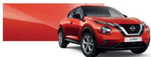
Czerwony Fuji Sunset - NBV