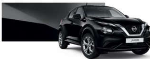
Czarny - Z11