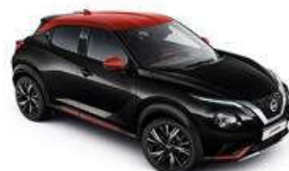
Czarny + Czerwony Fuji Sun Red dach - XFC