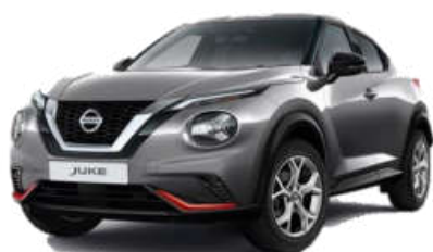
Miejsko pakiet pomarańczowy