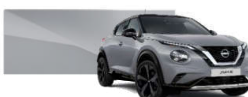
Szary ceramiczny - KBY