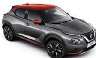
Szary + Czerwony Fuji Sun Red dach - XFB