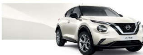
Biały perłowy - QAB