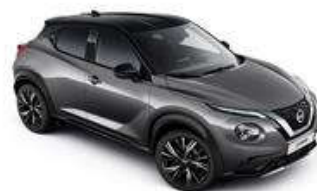
Szary + Czarny dach - XDJ