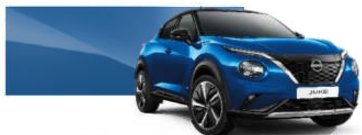
Niebieski - RCF