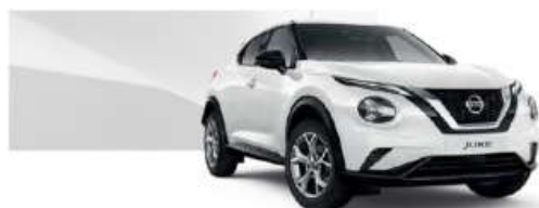
Biały - 326

Lakier metalizowany / premium - 2.400 zł