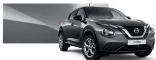
Szary - KAD

Lakier metalizowany / premium - 2.400 zł