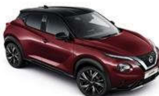
Burgundowy + Czarny dach - XDX