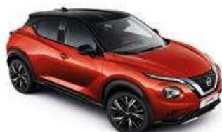
Czerwony Fuji Sun Red + Czarny dach - XEV