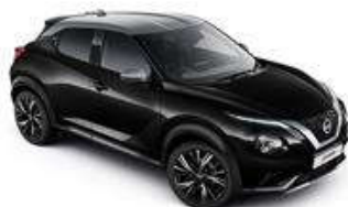
Czarny + Srebrny dach - XDZ