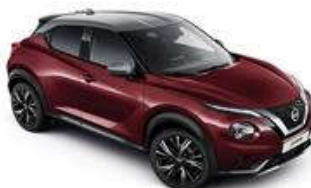
Burgundowy + Srebrny dach - XEE