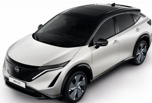
Biały perłowy + czarny dach i lusterka [XGA]