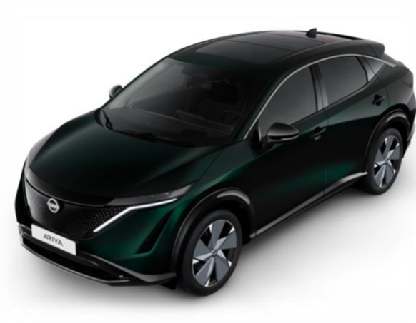
Zielony perłowy AURORA [DAP]