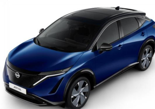
Niebieski perłowy + czarny dach i lusterka [XGU]