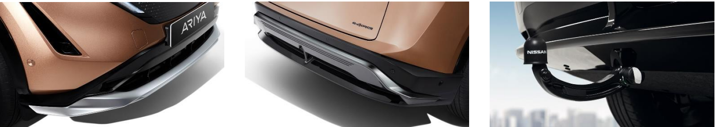
Przykładowe nakładki w kolorze srebrnym/satynowym.