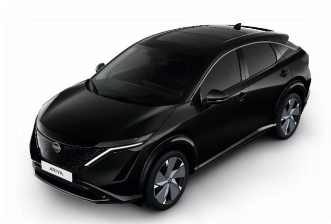
Czarny perłowy [GAT]

Lakier metalizowany / perłowy (jednokolorowe nadwozie) – 4 000 zł 1