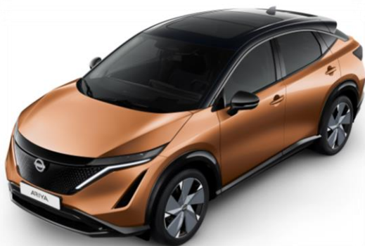
Miedziany metalizowany AKATSUKI + czarny dach i lusterka [XGJ]

Lakier metalizowany / perłowy + dach i lusterka w kolorze czarnym – 7 000 zł 1