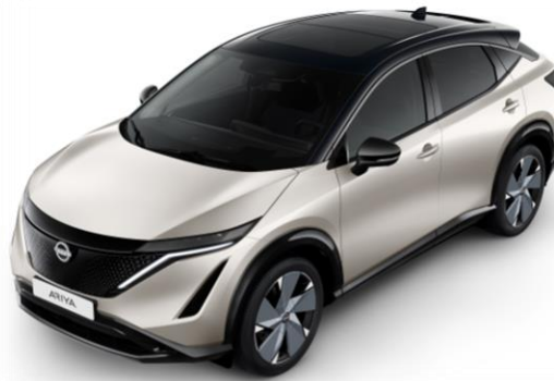
Srebrny metalizowany + czarny dach i lusterka [XGV]