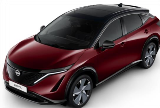
Burgundowy metalizowany + czarny dach i lusterka [XGG]