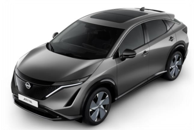
Szary metalizowany [KAD]